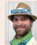
セイン=カミ (障害者自立支援アンバサダー) 一般社団法人障がい者自立推進機構 理事 一般社団法人ハートリボン協会 ハートリボン大使 タレント